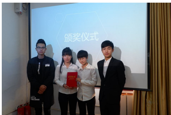
(汽车工程学院 李克强)