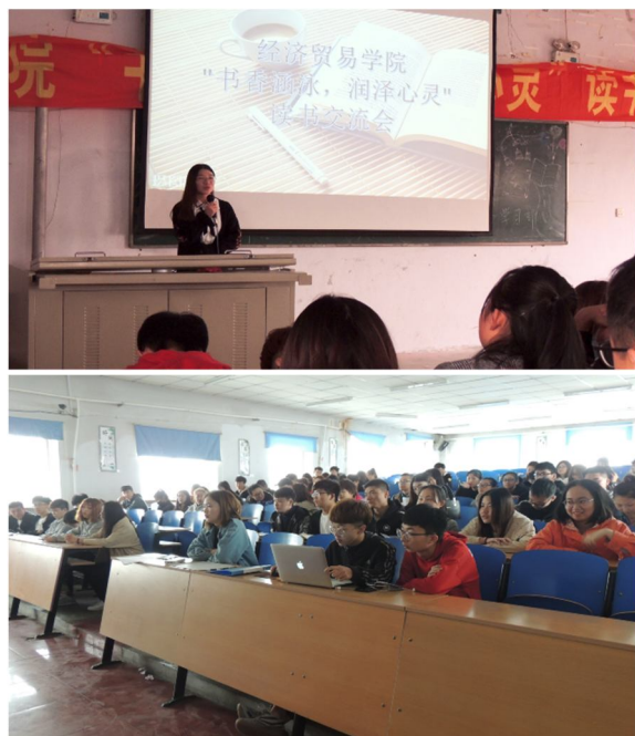
(经济贸易学院 周倩倩)

了一个展示自我、锻炼自己语言表达能力的平台，同时为我院接下来的学风建设工作打下坚实基础。