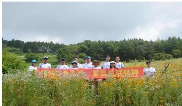
到达抗联路松岭山顶

实际情况。在法律宣传进基层工作中，同学们深入浅出的法律知识讲解得到了村民们的好评。