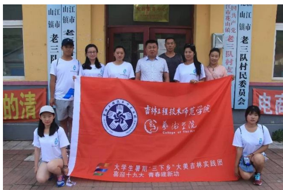
艺术学院志愿团队协助村内干部对贫困群众进行调研考察精准扶贫

市团市委及各乡镇党委、团委的安排下，艺术学院志愿团队分为四个小组到临江市花山镇四个辖村，协助村内干部，对贫困群众进行调研考察、并助力精准扶贫和普法宣传。了解贫困群众们的生活状态、资金来源以及身体健康状况。加深了我们对习近平总书记“精准扶贫”重要讲话精神的了解。从而使得我们更加了解华山镇的