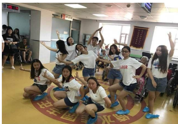
同学们为老人表演舞蹈

在表演夜幕之余，我们还给老人们帮助，和他们谈心交流，关心他们的日常生活，给老人们打扫房间、清理垃圾。老人们需要的不是过多的物质需求，而是更多的陪伴与关怀。在与老人的交谈中，我们尽量做到不触及老人的隐私和一些伤心事，因为大部分来到这里的老人都是由于儿女不愿意照顾他们或是不想照顾他们，他们渴望家的温暖，亲人的陪伴，这是无论再好的生活条件都不能替代的。