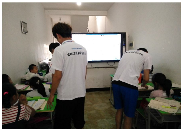
外语学院学生正在检查留守儿童的单词

实践团还深入黑石镇小区，悬挂横幅，携带慰问以推进深化改革、扎实发展民生、改善民生为主题进行了宣传与讲解，得到了村民的热情欢迎和积极帮助。