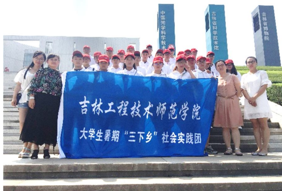
中国科学院长春光学精密机械与物理研究所

到中国科学院长春光学精密机械与物理研究所和中国科学院长春光学精密机械与物理研究所研究生部，通过开展专业学习、就业创业调研、传统企业文化、城市企业发展等主题寻访活动，引导大学生深入社会，开拓专业思维，拓宽就业渠道。在寻访过程中还深入中国科学院长春光学精密机械与物理研究所研究生部，记录研究所突出人物的“奋斗故事”，学习如何在企业中成长，激励同学们在毕业之际提升自己的综合能力，学习如何迅速适应在企业中