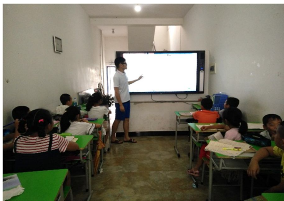
外语学院学生为留守儿童辅导功课

本着“快乐英语,你我梦想”的主题通过给留守儿童讲授英语单词,教唱英文歌曲,与他们进行课堂互动,如期高质的完成了本次活动。让留守儿童体会到了社会对他们的关爱,解决了他们承担不起学习英语费用的难题。