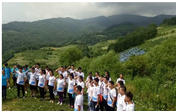
在抗联英雄牺牲地重温入党誓词

临江市并不仅拥有壮丽怡人的大好河山，也矗立着可歌可泣的红色丰碑。艺术学院社会实践团队在临江市团委的带领下重走红军抗联路，参观了“四保临江”纪念馆。同学们观看了沿途的战斗遗址，缅怀革命烈士。那些先辈们可歌可泣的战斗历程，浴血奋战的战斗场面仿佛在我们眼前呈现。通过此次“红色之旅”，我们团队接受了一次深刻的爱国主义和革命传统教育，让我们对“红色”有了更加深刻的感悟。