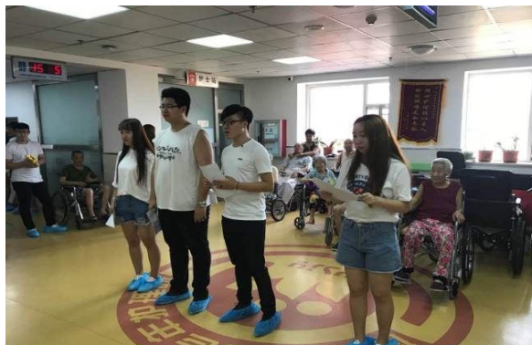
同学们表演诗朗诵

增添更多欢乐的时光。而我们的同学们也特意为老人们编排准备了许多精心的节目——舞蹈、诗朗诵、歌曲表演等。