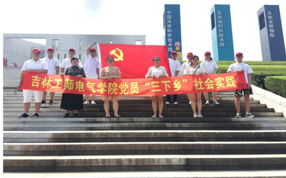
中国科学院长春光学精密机械与物理研究所 研究生部

工作和学习。参观学习结束后整理并开展宣传，开展“记录青春——奋斗的青春最美丽”活动，激励更多的同学参加到学习实践中来，引导即将就业的同学们投入到就业创业的奋斗中，尽快尽早的完成社会角色的转变。