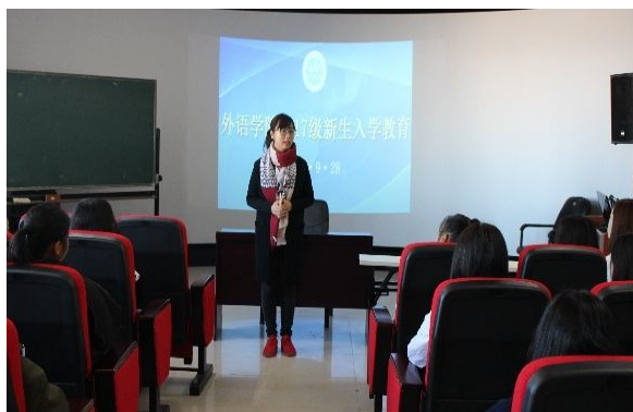
修杨副院长鼓励大家学会坚持

一名外语学院学生的行为准则, 建议同学们对认真对未来的思考和计划好大学四年里应该完成的任务。