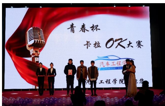
(汽车工程学院 李克强)